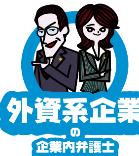
外資系企業 の 企業内弁護士

国内企業に所属する企業内弁護士の特徴としては、平均年齢が低いことが挙げられます。多くの国内企業は、長い年月をかけて、弁護士資格を持たない法務部員による法務部体制を構築してきています。しかし、最近、若手の弁護士を少しずつ採用し、こうした従来の体制を少しずつ置き換えていくという企業が徐々に増えている傾向にあります。弁護士経験5年未満程度での入社が多く、司法修習生からの採用を行っている企業も少なくありません。