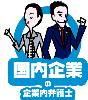
国内企業 の 企業内弁護士

企業内弁護士とは、企業の従業員、使用人、役員として職務を遂行している弁護士のことをいいます。企業内弁護士を「社内弁護士」、企業の外で働く弁護士を「社外弁護士」と呼ぶこともあります。企業内弁護士といってもその仕事は様々で、所属する企業の業種や規模、所属部署や権限などによって大きく異なります。