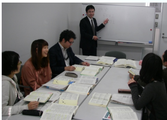
〔助教による指導の様子〕