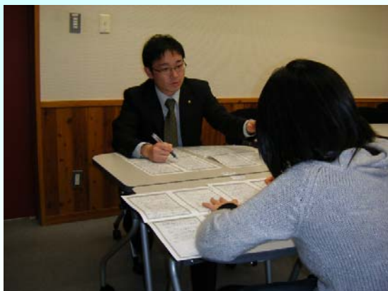
〔法律文書作成指導の一コマ〕