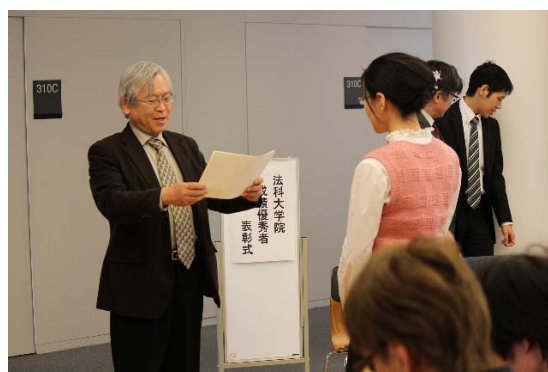
〔成績優秀者表彰式〕